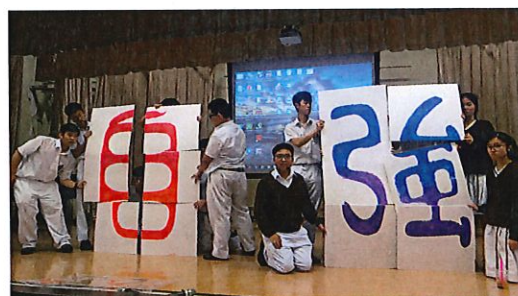
輔導組學長以短劇分享他們與中一同學相處時的小故事，並勉勵同學。