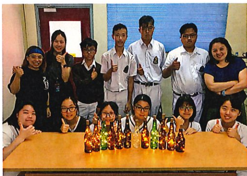
「Say Hello to Work」- 本地玻璃手作家為同學舉辦工作坊, 分享創業的心路歷程

5-8月 「友友」中四級潛能發展計劃---小組活動、社區服務日、成果分享會及工作實習