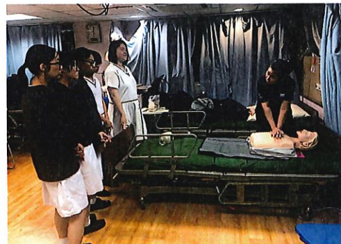
「Say Hello to Work」- 體驗醫護界的工作

5月 「Say Hello to Work」中五級生涯規劃及體驗計劃---小組活動及行業體驗