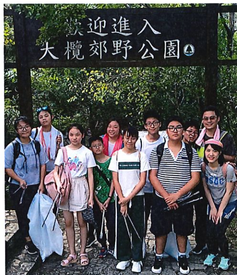
義工隊——清潔屯門郊遊徑