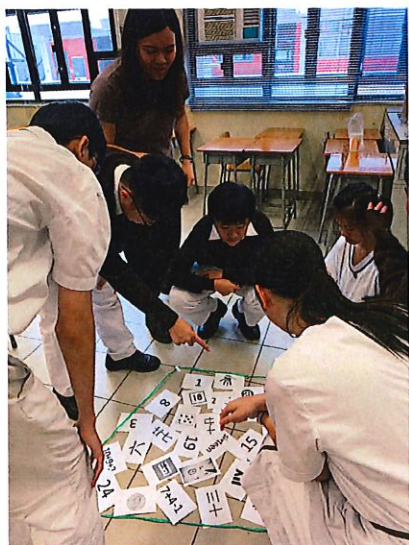
校園 Fun 一 Fun