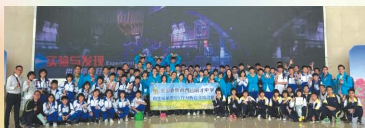
參觀廣州大學城廣東科學中心