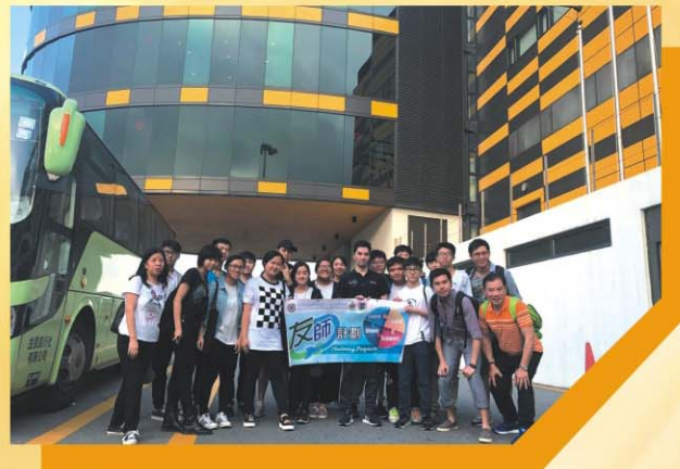
參觀澳門格蘭披治大賽車控制中心