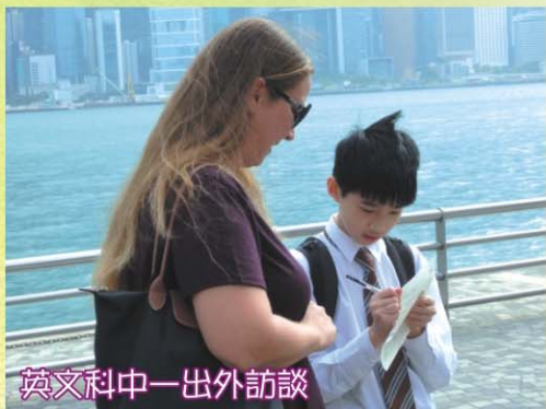
英文科中一出外訪談