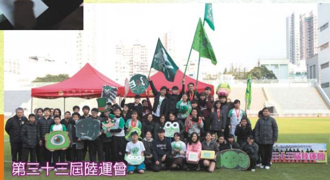
第三十三屆陸運會