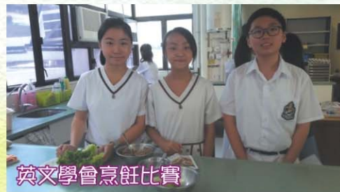
英文學會烹飪比賽