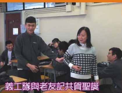
義工隊與老友記共賀聖誕