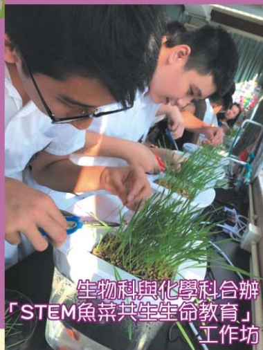
生物科與化學科合辦「STEM魚菜共生生命教育」工作坊