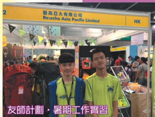
友師計劃·暑期工作實習