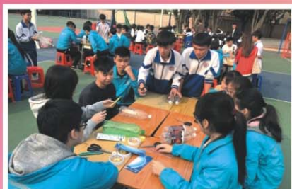
製作水火箭工作坊