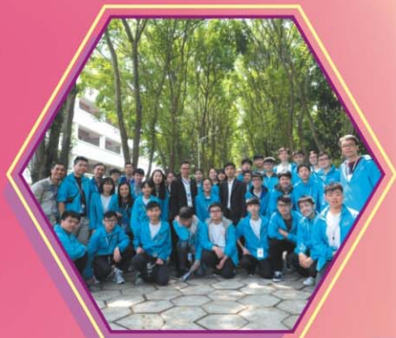
參觀欖核二中校園