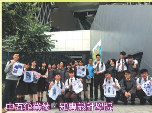
中五企業參·知專設計學院