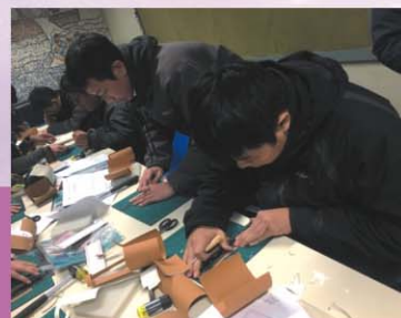
友同行振翅高飛計劃·皮革製作