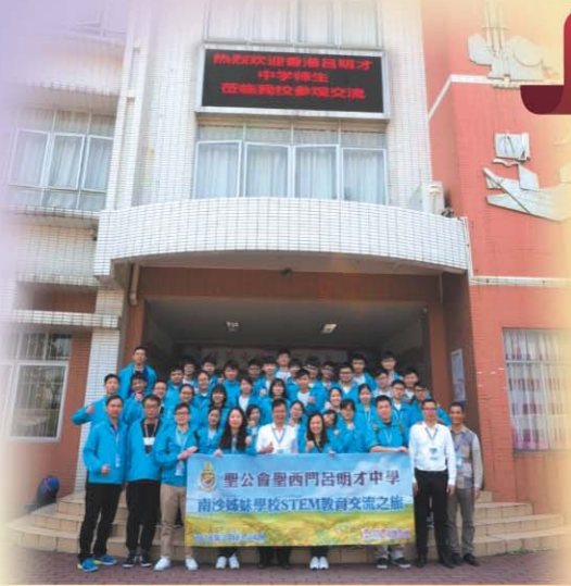
在欖核第二中學校門前大合照

第二天的上午，欖核第二中學為我們舉辦了大型的「製作水火箭工作坊」。活動在戶外舉行，兩地百多名師生分組合力製作水火箭，並在足球場即時測試。當師生們看見水火箭能成功發射到50米以外時，確實大開眼界，實在感謝欖核第二中學師生們的用心教授及分享製作技術的心得。最後，STEM教育交流之旅以兩校學生到廣州大學城廣東科學中心參觀作結。活動不單讓學生提升對科學的興趣和知識，開闊學生視野，更有助兩校學生在整個交流活動中彼此加深認識，互相欣賞及學習。大家都樂在其中，並熱切期待下一次的會面！