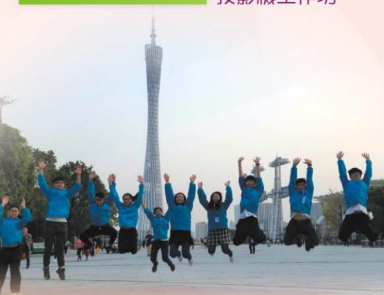
參觀廣州花城廣場

除此之外，廣州大學城內的廣州科學中心也令我另眼相看。其中，包含十數個不同主題的展館，包含的內容和知識更是多姿多彩。可惜時間有限，只能參觀數個主題展館，但也足以讓我大開眼界。如果有幸能再次到廣州和我們的姊妹學校交流，必能令我碩果纍纍。