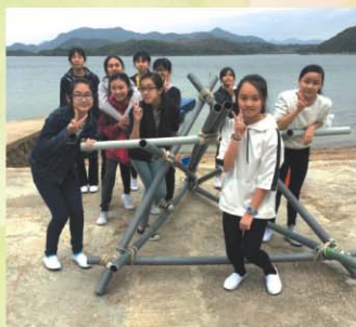
女童軍戶外學習營·製作「羅馬炮架」