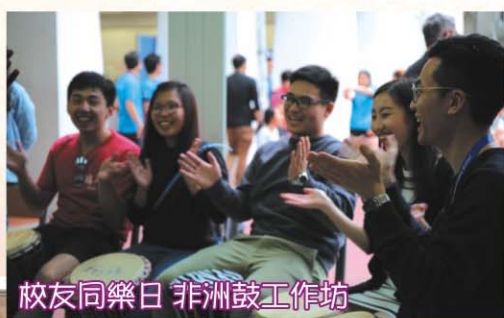
校友同樂日 非洲鼓工作坊