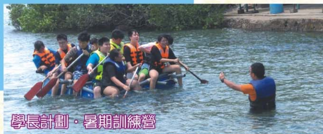
學長計劃·暑期訓練營