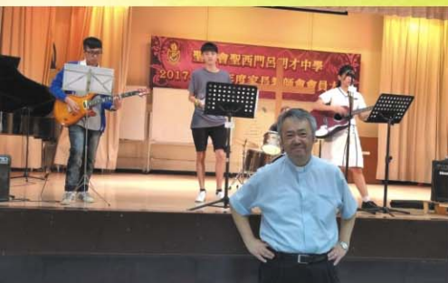
青彼樂隊·福音周午間音樂會