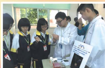
本校學生教授DNA指紋分析之「親子鑑證」實驗