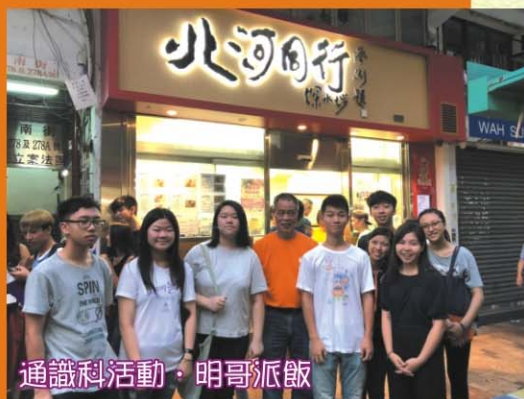
通識科活動·明哥派飯