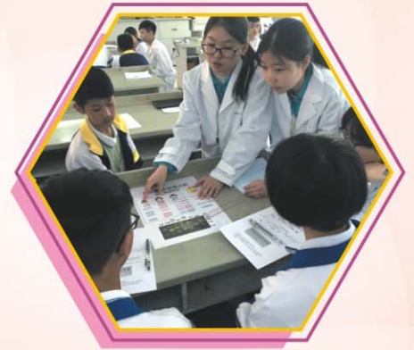
DNA指紋分析之「親子鑑證」實驗

總括而言，今次的交流團讓我獲益良多，加深了我在科學方面的知識。若有機會，我衷心希望能到其他地方參與交流活動，擴闊自己的視野。