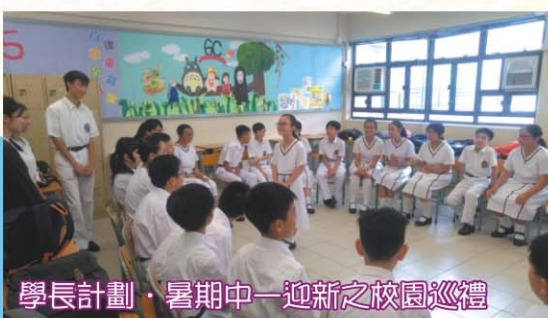
學長計劃·暑期中一迎新之校園巡禮