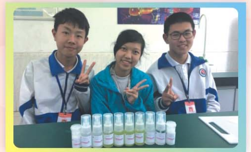
防蚊液、乳液、化妝水DIY工作坊