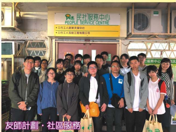
友師計劃·社區服務