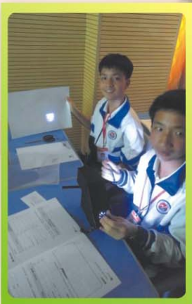
製作實物 投影機工作坊