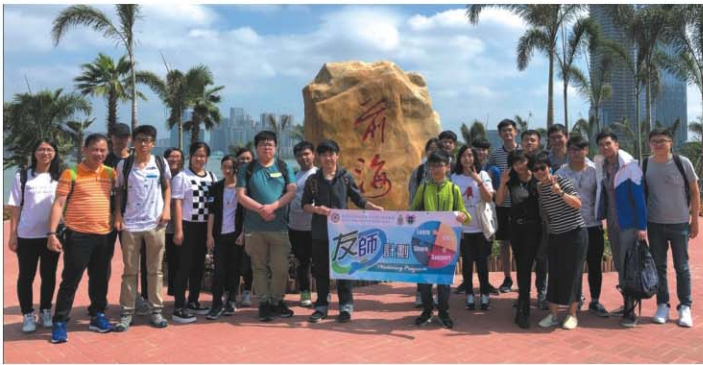
於前海地標大石頭前合照

還記得上學年，因不想虛度光陰而瘋狂報名參加各種交流團、參觀活動，而令我難以忘懷的就是參與了「友師計畫」其中一項活動「走進珠三角·一小時生活圈體驗」活動，可謂是畢生難忘。