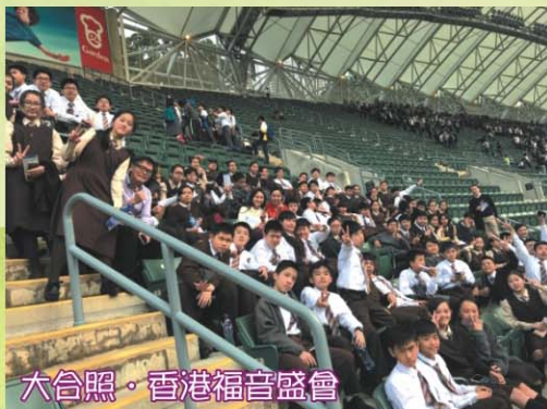
大合照·香港福音盛會