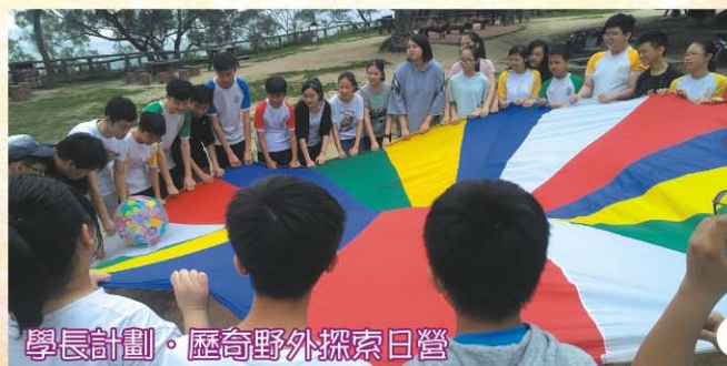
學長計劃·歷奇野外探索日營