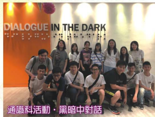
通識科活動·黑暗中對話